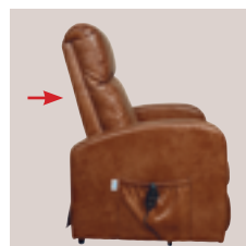
Grand dossier réglable en profondeur