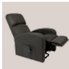
Position jambes relevées