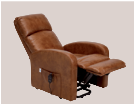
Dossier incliné, jambes relevées