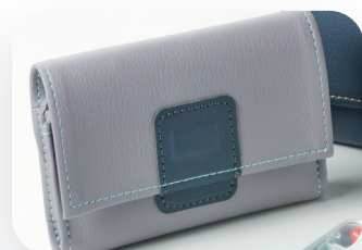
Petit et compact