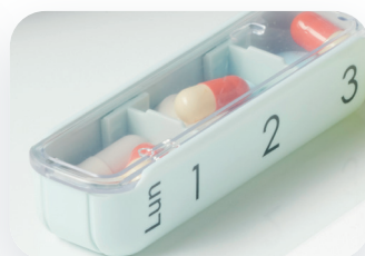
Jusqu'à 3 prises par jour