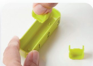
Facile à enlever ou à déplacer