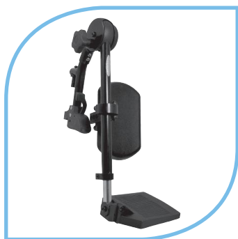
Repose-jambes à compensation avec système à molette.